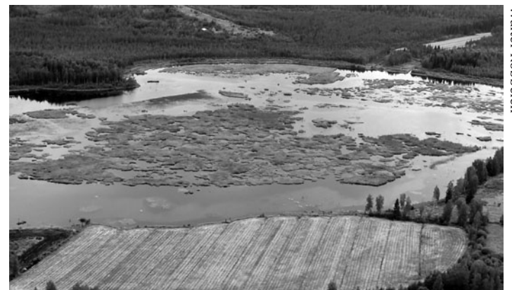
Rantasenjärvi vuonna 2010.

On erinomainen asia, että kaupunki tukee näitä aktiviteetteja (WR).