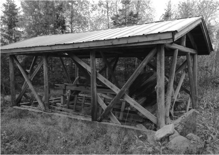
Pärehöylä oli ennen tärkeä työkalu, kun kattopäreitä tarvittiin.