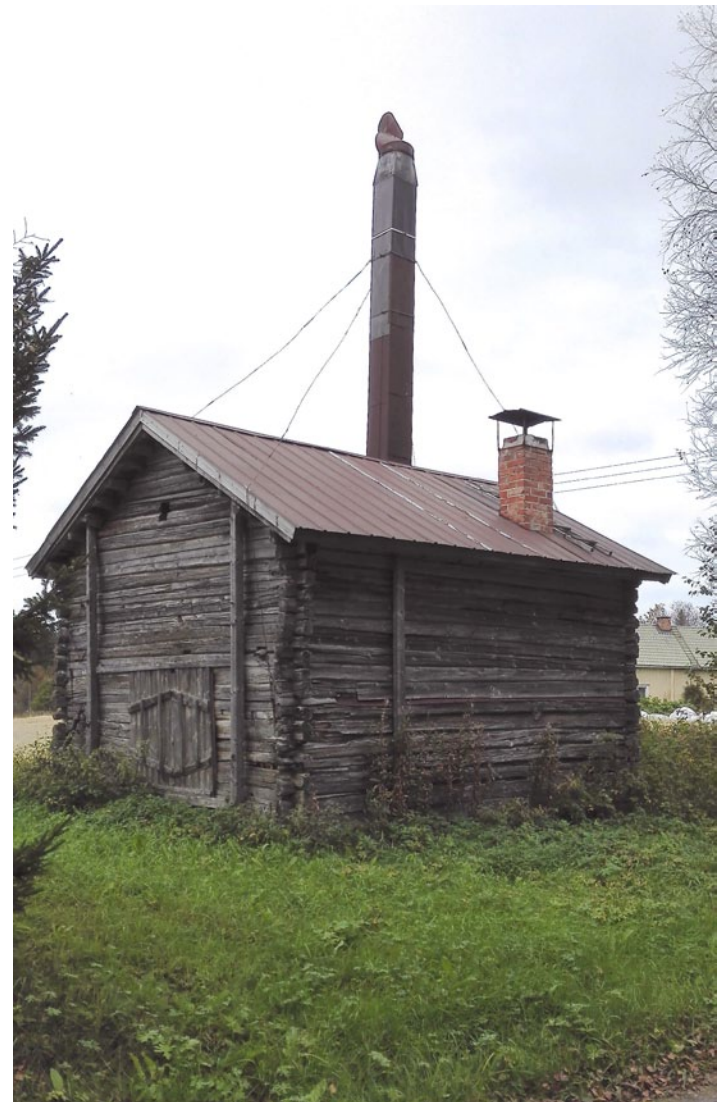
Vanhaa rakennuskantaa Perukalla.