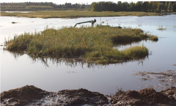
Turvelautat, joiden koko voi olla jopa 50 x 30 metriä, vedetään lopuksi vinsillä rantaan.