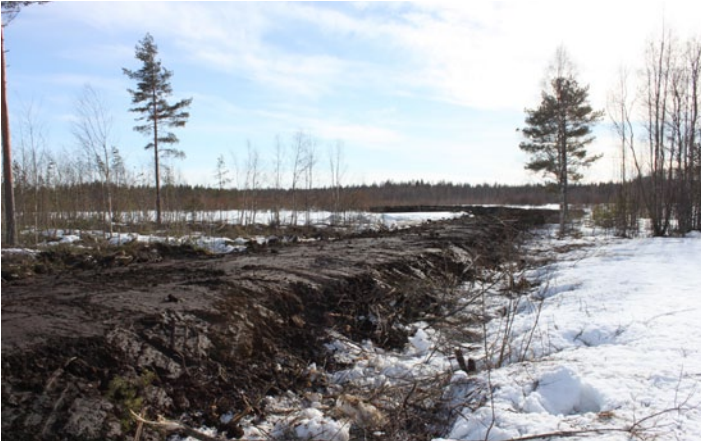
Jotta työkoneet saatiin veteen ja rantaan, piti edellisellä talvela rakentaa työmaantie. Penkereen vahvistukseen käytettiin rankoja.