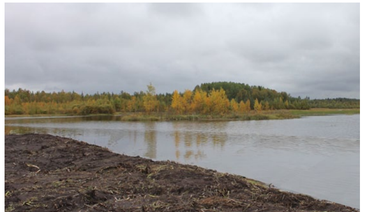
Tässä on esimakua kunnostetusta järvestä.