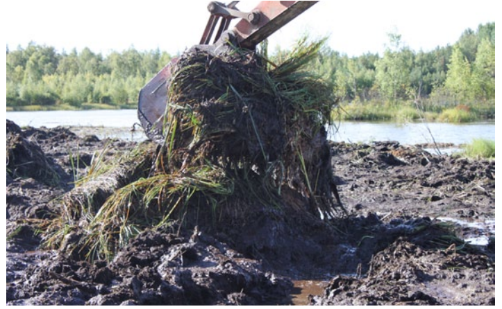
Virallisen termin mukaan kyseessä on niitto. Päinvastoin kuin varsinaisella niitolla käytetyllä menetelmällä lähtee myös vesikasvillisuuden juuristo. Toimenpide on pitkävaikutteinen.